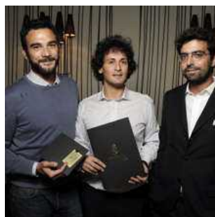
I soci fondatori di City Guru